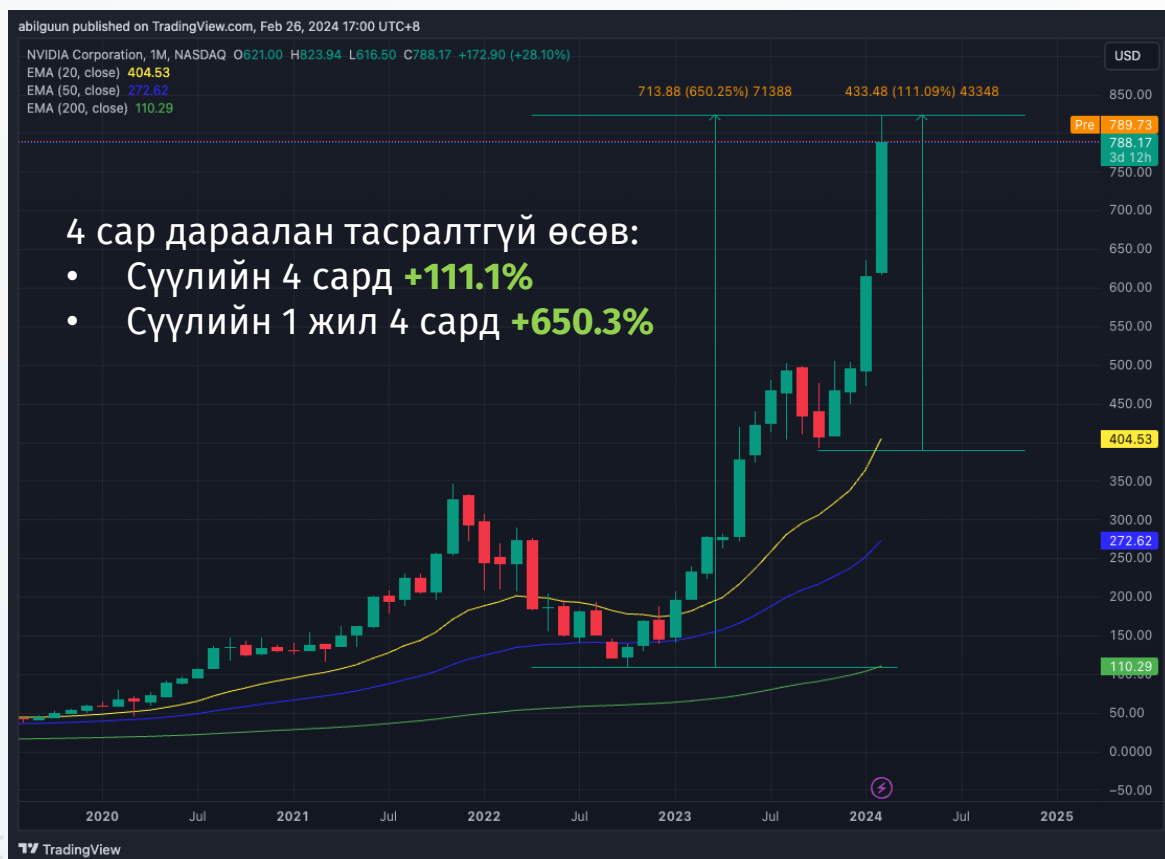
График 1: NVIDIA компанийн хувьцааны ханш /сараар/

Мэдэгдэл: Энэхүү судалгаанд дурьдагдсан аливаа таамаглал нь зөвхөн мэдээллийн зорилготой бөгөөд аливаа хөрөнгө оруулалт, арилжаа хийхийг ятгасан, санал болгосон үйлдэл биш болно. Энэхүү судалгаанд дурьдагдсан таамаглалаас үүдэн гарах аливаа эрсдэлийг шинжээчи болон компани хариуцахгүй болно. Энэхүү тойм, судалгаа, таамаглалыг зөвхөн өөртөө зориулан ашиглаж, бусдад түгээн олшруулахыг хатуу хориглоно.