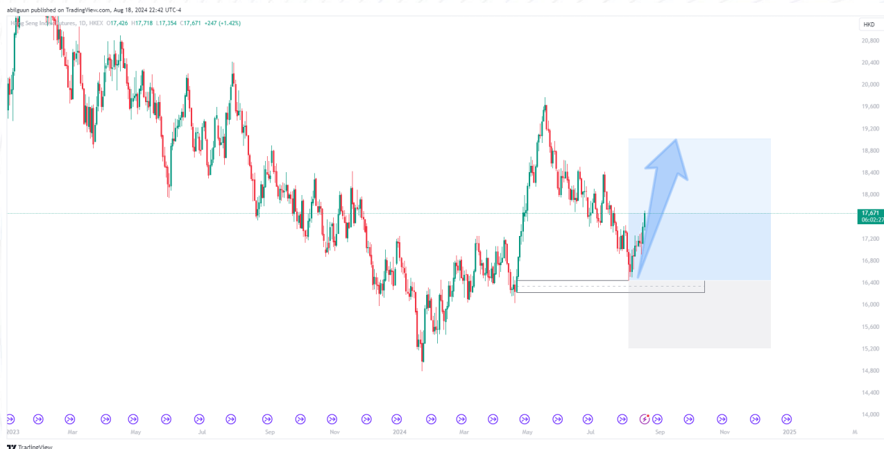
График 2: Hang-Seng индексийн ханшийн таамаг

Эдийн засгийн зарим үзүүлэлтүүд суларсан ч Хятадын төв банк хүү бууруулах магадлалтай гэсэн хүлээлт зах зээлд эерэг хандлага төрүүлж байна. Гэсэн хэдий ч үл хөдлөх хөрөнгийн зах зээлийн удаашрал хэрэглэгчдийн итгэлийг сулруулсаар байгаа нь зах зээлд тодорхойгүй байдал үүсгэж байна.