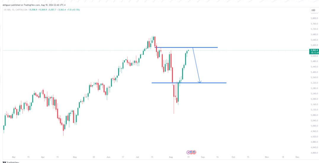
График 1. АНУ-ын S&P 500 индексийн ханшийн таамаглал

Баасан гарагт АНУ-ын Худалдааны яамнаас гаргасан тайланд барилгын зөвшөөрөл анх удаа 2020 оны цар тахлын гүн үед байсан 1.4 саяас доош түвшинд хүрсэн гэж мэдээллээ. Үүний нэгэн адил, пүрэв гарагт гарсан барилгын салбарын итгэлцлийн