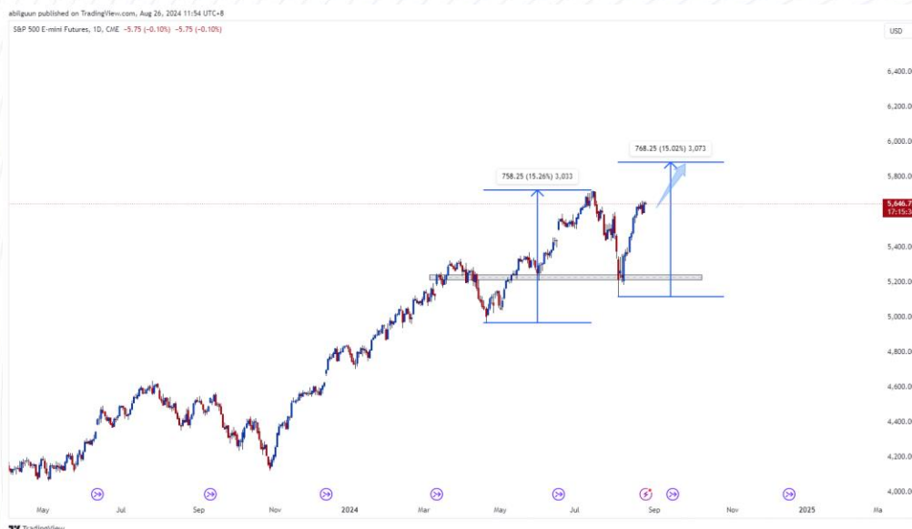
График 1: АНУ-ын S&P500 индексийн ханшийн таамаглал

Эдийн засаг сулар нь гэсэн хүлээлт болон ХНС-аас хүүг бууруулах хүлээлт нь 30 жилийн хугацаатай тогтмол хүүтэй зээлийн дундаж хүүг 6.46% болгож бууруулжээ. Уг хүү нь 2023 оны 10-р сард 7.79 хувьд хүрэн дээд цэгээ тогтоогоод байсан юм. Хүү буурахтай зэрэгцэн орон сууцны борлуулалт баг зэргээр нэмэгдсэн . ХНС-аас ирэх 9-р сард хүүгээ бууруулна гэсэн хүлээлт орон сууцны зах зээлийг идэвхжүүлж байна.