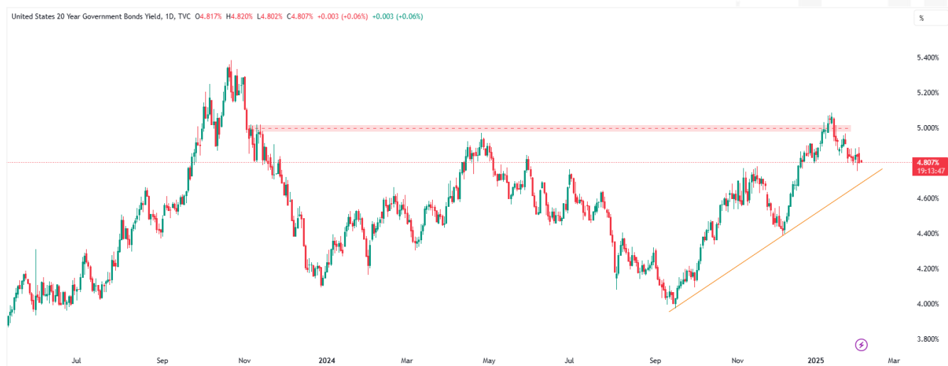
График 1. АНУ-ын урт хугацаат бондын өгөөж

АНУ-ын 20 жилийн засгийн газрын бондын өгөөж 4.807%-д тогтворжиж, 4.80%-ийн дэмжлэгийн түвшинд тулж байна. Өмнө нь 5.00%-ийн эсэргүүцлийг сорьсон ч давж чадаагүй нь богино хугацаанд өсөлтийн хязгаар байгаа гэдгийг илтгэж байна. Холбооны Нөөцийн Банкны бодлого тодорхой бус, инфляцын түвшин 2.9%-д өндөр хэвээр байгаа нь бондын өгөөж буурахгүй байх нөхцөлийг хадгалж байгаа ч бондын хүү 4.60% руу унах магадлалтай.