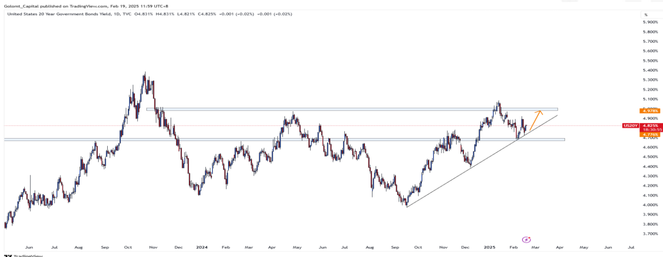
График 1. АНУ-ын урт хугацаат бондын өгөөж

АНУ-ын 20 жилийн засгийн газрын бондын өгөөж 4.824%-д тогтворжиж, 4.680%-ийн дэмжлэгийн түвшнээс дээш өслөө. Өмнө нь 5.08%-ийн эсэргүүцлийг сорьсон ч давж чадаагүй нь богино хугацаанд өсөлтийн хязгаар байгаа гэдгийг илтгэж байна. Холбооны Нөөцийн Банк бодлогын хүүг яаран бууруулахгүй гэсэн шийдвэр болон Трампын тарифын нөлөөнөөс шалтгаалан 5.08% болон 5.42%-руу өсөх боломжтой.