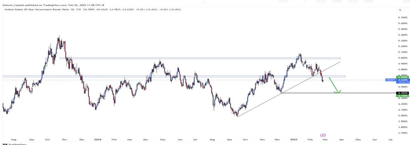
График 1. АНУ-ын урт хугацаат бондын өгөөж

Дэлхий даяар эдийн засгийн өсөлтөд эрсдэл үүсэж, инфляцийн дарамт багасч байгаа нь бондын стратегичдын бодлогыг өөрчилж, 2025 оны эхний хагаст 4-5% хооронд тогтмол байж магадгүй гэж таамаглаж байна.