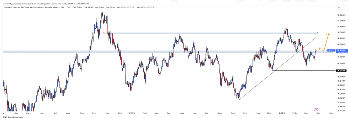
График 1. АНУ-ын урт хугацаат бондын өгөөж

АНУ-ын 20 жилийн хугацаатай бондын өгөөж 4.7%-ийн орчимд хадгалагдаж, хөрөнгө оруулагчид эдийн засгийн үзүүлэлтүүд, Холбооны Нөөцийн бодлого, боломжит тарифтой холбоотой мэдээллийг үнэлж байна.