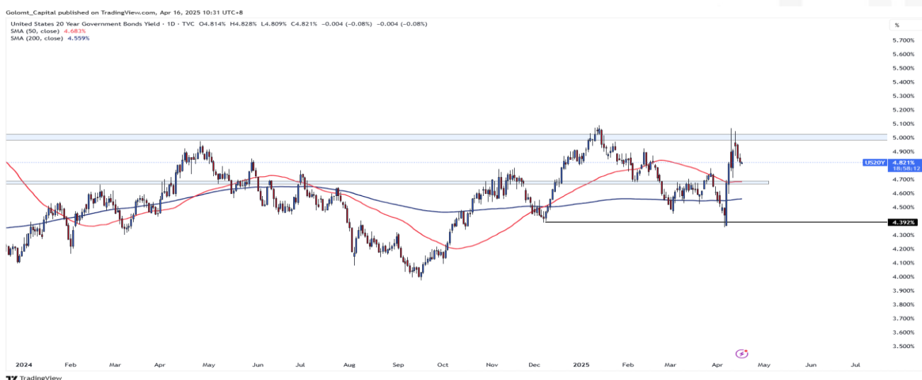
График 1. АНУ-ын урт хугацаат бондын өгөөж

АНУ-ын бондын өгөөж өсөж, 5.07% хүрэн өнөөдрийн байдлаар 4.81%-тай байна. АНУ-ын ерөнхийлөгч Дональд Трампын тарифын шийдвэрээс шалтгаалан эдийн засгийн тогтворгүй байдал нэмэгдэн хөрөнгө оруулагч нар бондоо зарж үнэ нь унаад байна.