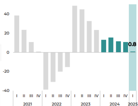
График 1. Уул уурхай (бодит ДНБ-н өсөлт, хувь)

2025 оны эхний дөрвөн сарын байдлаар (4-р сарын эцсийн дүнгээр) уул уурхайн бүтээгдэхүүн Монгол Улсын нийт экспортын 94 хувийг бүрдүүлсэн бөгөөд нүүрс болон зэсийн баяжмал хоёр дангаараа нийт экспортын 88 хувийг эзэлж байна.