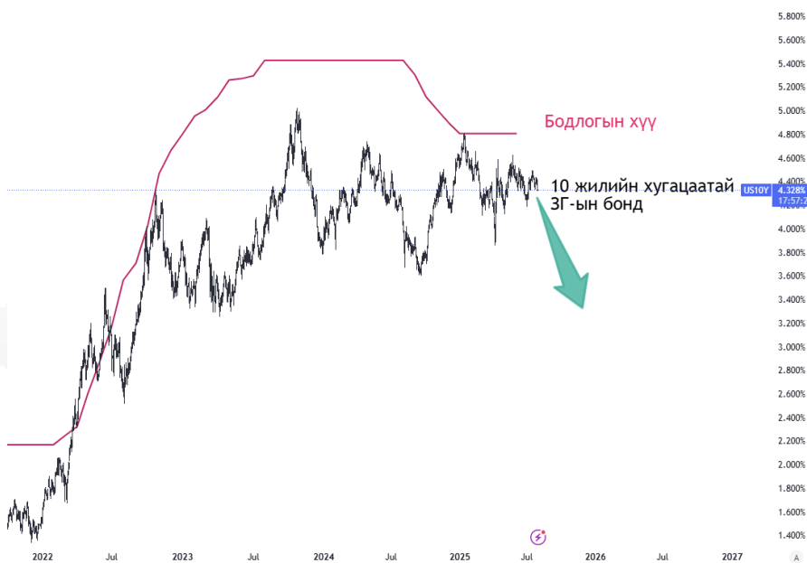
График 2. АНУ-ын 10 жилийн хугацаатай ЗГ-ын бондын өгөөж

Трамп бодлогын хүүг яаралтай бууруулахыг шаардаж байгаа бол, Пауэлл инфляц, эдийн засгийн нөхцөл байдлыг харгалзан түр хүлээх нь зүйтэй гэж үзэж байна. 7-р сарын 30 шөнө ХНС-н ээлжит хурал болох бөгөөд бодлогын хүүгийн талаарх шийдвэрийг танилцуулж зах зээлд өндөр савлагаа үүснэ.