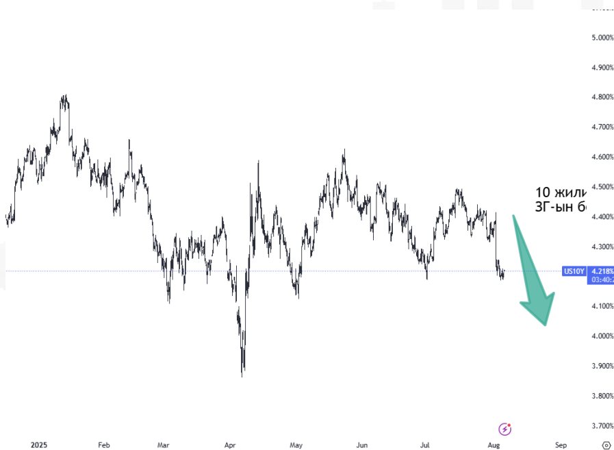
График 2. АНУ-ын 10 жилийн хугацаатай ЗГ-ын бондын өгөөж

Өнгөрсөн долоо хоногт ХНС-н ээлжит бодлогын хүүгийн хурал болж хүүг 4.25-4.5 хувийн түвшинд хэвээр нь хадгалах шийдвэр гаргасан. Үүнээс шалтгаалж АНУ-ын 10 жилийн хугацаатай ЗГ-ын бондын өгөөж 4.4%-иас 4.21% хүртэл унаад байна.