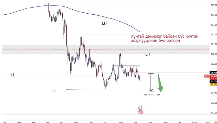
График 2. Ам.долларын индекс

Ам.долларын индекс 99 түдшнээс эсэргүүцэл аван доош унаж байна. Мэдээж бодлогын хүү буурах хүлээлт нэмэгдсэнтэй зэрэгцэн доллар зарах үзэгдэл нэмэгдэж байна. Ам.долларын индексийн дараагийн хүрэх зорилт 96.3