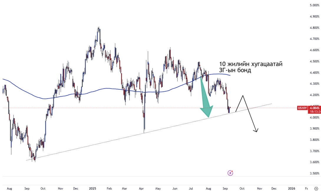
График 1. 10 жилийн хугацаатай АНУ-ын ЗГ-ын өгөөж

АНУ-ын Төв банк 9-р сарын 17-ны ээлжит хурал дээр бодлогын хүүгээ бууруулах магадлал 100% хүрээд байна. Сүүлийн нэг сарын хугацаанд АНУ-ын 2 жилийн хугацаатай ЗГ-ын бондын өгөөж 0.5%-иар буурсан бол Монголын ЗГ болон ОУ-ын зах зээл дээрх корпорацын бондуудын өгөөж тогтвортой хэвээр байна. Хэрэв ФРС 9-р сарын дунд үед бодлогын хүүгээ бууруулбал, хөгжиж буй зах зээлийн бондуудын өгөөж цаашид буурах нь тодорхой. Өөрөөр хэлбэл ам.долларын бондуудын ханш өсөх хүлээлттэй байна.