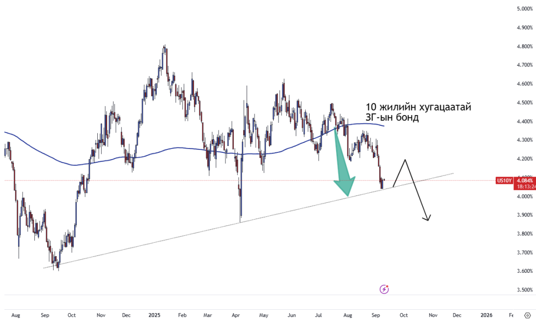
График 1. 10 жилийн хугацаатай АНУ-ын ЗГ-ын өгөөж

АНУ-ын Төв банк 9-р сарын 17-ны ээлжит хурал дээр бодлогын хүүгээ бууруулах магадлал 100% хүрээд байна. Сүүлийн нэг сарын хугацаанд АНУ-ын 2 жилийн хугацаатай ЗГ-ын бондын өгөөж 0.5%-иар буурсан бол Монголын ЗГ болон ОУ-ын зах зээл дээрх корпорацын бондуудын өгөөж тогтвортой хэвээр байна. Хэрэв ФРС 9-р сарын 17-нд бодлогын хүүгээ бууруулбал, хөгжиж буй зах зээлийн бондуудын өгөөж цаашид буурах нь тодорхой. Өөрөөр хэлбэл ам.долларын бондуудын ханш өсөх хүлээлттэй байна.