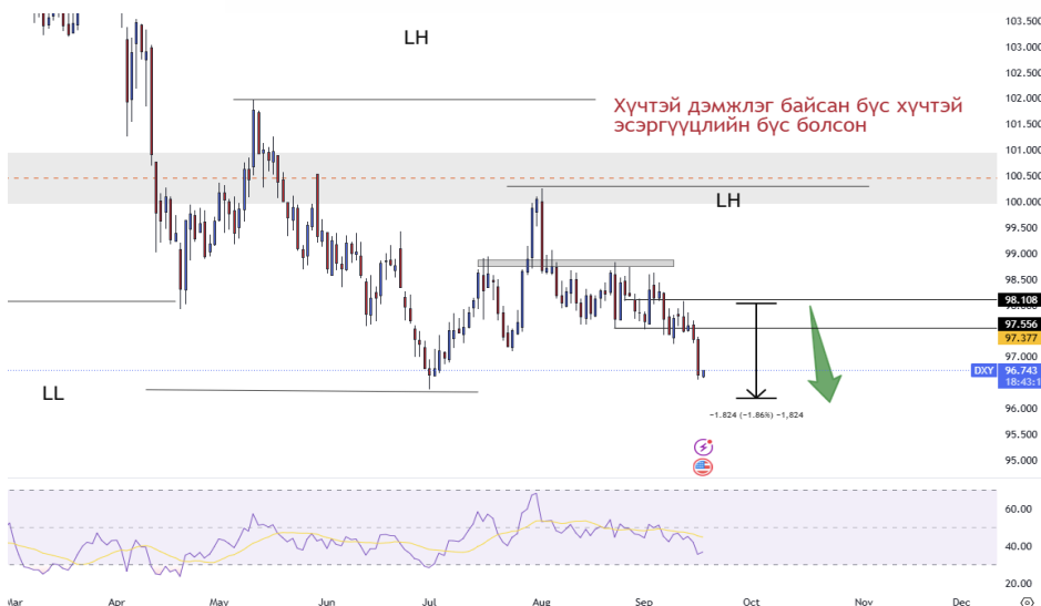
График 2. Ам.долларын индекс

Ам.долларын индекс 99 түвшнээс эсэргүүцэл аван доош унаж байна. Мэдээж бодлогын хүү буурах хүлээлт нэмэгдсэнтэй зэрэгцэн доллар зарах үзэгдэл нэмэгдэж байна. Ам.долларын индексийн дараагийн хүрэх зорилт 96.3