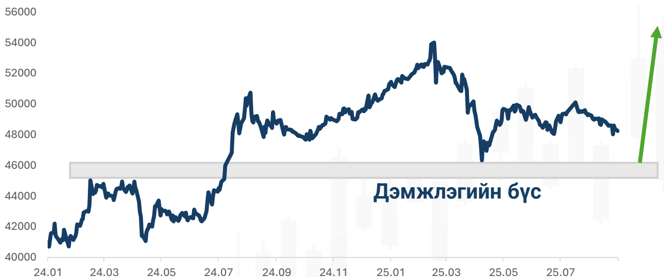
График 2. ТОП-20 индексийн ханшийн өөрчлөлт

ТОП-20 индекс 2025 он гарснаар 6.23 хувиар унаад байна. Компаниудын орлого эхний хагас жилд өссөн ч гэсэн цэвэр ашиг өнгөрсөн оны мөн үеэс буурсан үзүүлэлттэй байлаа. Ханш 46,300 түвшин рүү үргэлжлэн унах магадлал өндөр бөгөөд 46,300 хүчтэй дэмжлэгийн бүс болж байна. Энэ оны сүүлийн улиралд индекс хүчтэй өсөх магадлалай.