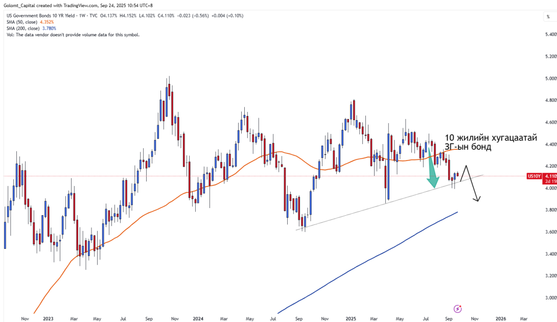
График 1. 10 жилийн хугацаатай АНУ-ын ЗГ-ын өгөөж

Ам.долларын бондод хөрөнгө оруулах алтан үе ирээд байна