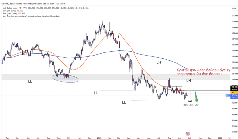
График 2. Ам.долларын индекс

АНУ-ын Төв банк 9-р сарын 17-нд бодлогын хүүгээ 0.25 хувиар бууруулж, хүлээлтийн дагуу шийдвэрийг гаргалаа. Ингэснээр АНУ-ын 10 жилийн хугацаатай бондын өгөөж өслөө. Хүү буурснаар хуучин бондуудын эрэлт нэмэгдэж үнэ нь өсдөг зүйл ажиглагддаг. Мөн энэ ондоо багтаад дахин 2 удаа хүүг бууруулна гэсэн хүлээлт байгаа учраас үргэлжлэн бондын өгөөж таамаглалын дагуу буурах магадлал өндөр хэвээр байна. 10 жилийн хугацаатай бондын өгөөж 3.84% хүртэл буурах магадлал өндөр байна.