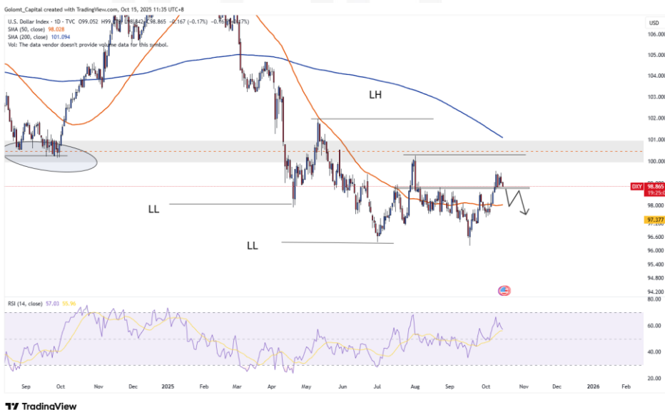
График 2. Ам.долларын индекс

Ам.долларын индекс 99 түвшнээс эсэргүүцэл аван доош унаж байна. Бодлогын хүү буурч доллар зарах хүмүүс ихэсч байгаагаас гадна алтны ханш өдөр ирэх тусам нэмэгдэж байна. Үргэлжлэн долларын индекс 96.24 гэсэн түвшинг сэтлэн доош унах магадлалтай.