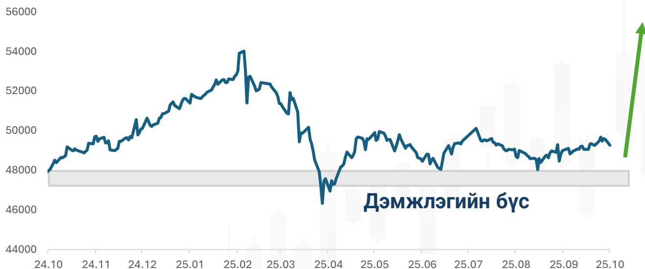
График 1. ТОП-20 индексийн ханшийн өөрчлөлт

ТОП-20 индекс 2025 он гарснаар 6.23 хувиар унаад байна. Компаниудын орлого эхний хагас жилд өссөн ч гэсэн цэвэр ашиг өнгөрсөн оны мөн үеэс буурсан үзүүлэлттэй байлаа. Ханш 46,300 түвшин рүү үргэлжлэн унах магадлал өндөр бөгөөд 46,300 хүчтэй дэмжлэгийн бүс болж байна. Энэ оны сүүлийн улиралд индекс хүчтэй өсөх магадлалай.