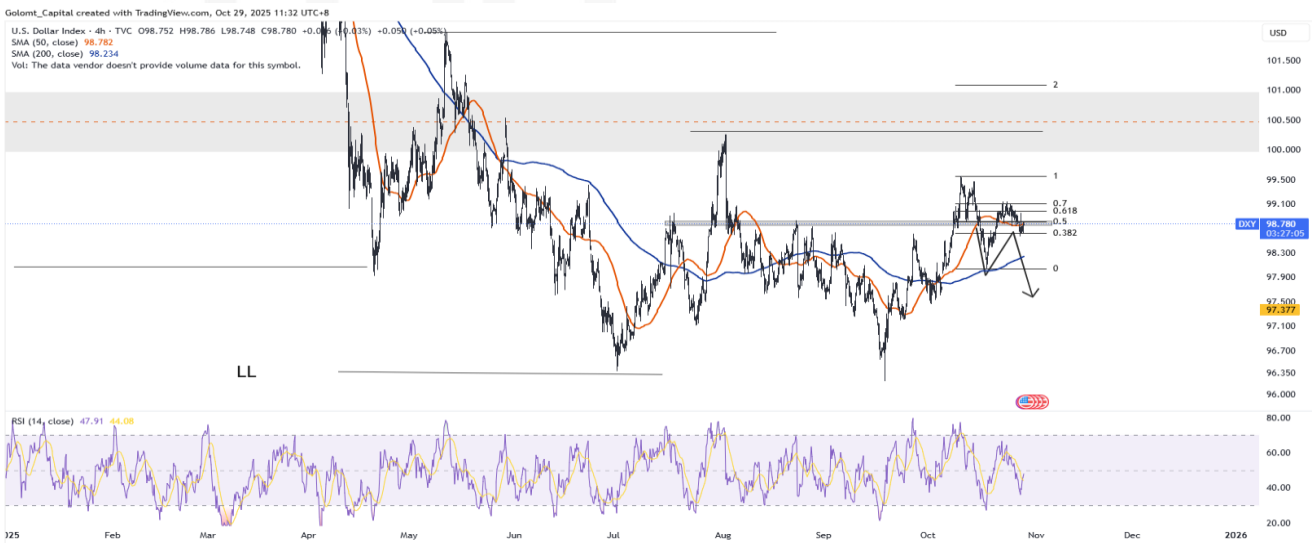
График 2. Ам.долларын индекс

Мөн хэрэв 2 жилийн дараа төгрөгийн ам.доллартай харьцах ханш 4168₮ хүрч байж өгөөж тэнцэнэ.