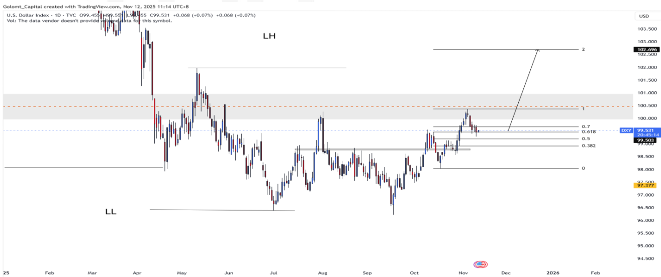
График 2. Ам.долларын индекс

ADP-ийн тайлангаар АНУ-ын компаниуд 10-р сарын сүүл хүртэл долоо хоногт дунджаар 11,000 ажлын байр хасч байсан нь хөдөлмөрийн зах зээл суларч буйг харуулжээ. Үүний дараа долларын ханш унаж, ХНС 12-р сард хүү бууруулна гэсэн хүлээлт эрчимжив. АНУ-ын 10 жилийн бондын өгөөж 4.08%-д, 2 жилийн өгөөж 3.56%-д буурсан байна.