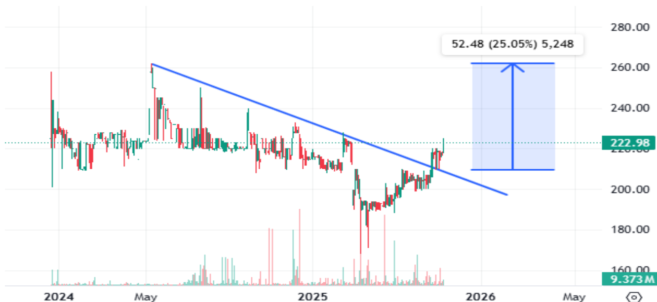
График 1. QPAY хувьцааны ханшийн график

QPAY хувьцааны ханш өнгөрсөн долоо хоногт 3 гаруй хувиар өсөж, 9-р сараас хойш 15 орчим хувиар өсөөд байна. Цаашдаа ханшийн зорилтот түвшинг 260₮ гэж таамаглаж байгаа бөгөөд үнэлгээний үзүүлэлт хамгийн бага хувьцаануудын нэг хэвээр байна. Мөн өнгөрсөн долоо хоногт 8.5 тэрбум төгрөгийн багцийн арилжаа хийгдэж, нийтдээ 9.05 тэрбум төгрөгтэй тэнцэх хэмжээний арилжаа хийгдлээ.