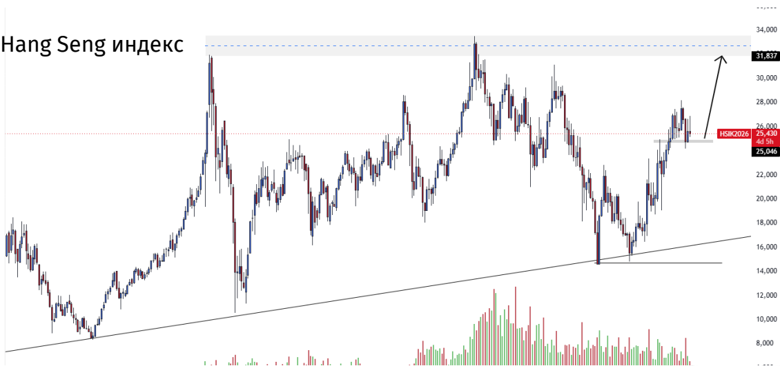
Hang Seng индекс