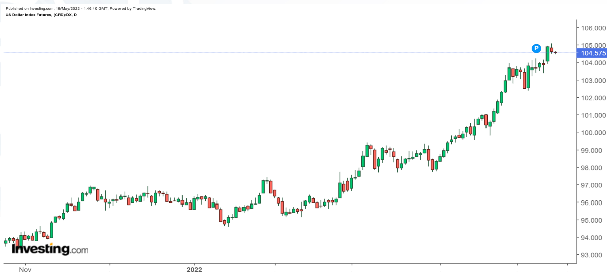
График 3 : DXY /ам.долларын индекс/-ийн 7 хоногийн лаа

Мэдэгдэл: Энэхүү судалгаанд дурьдагдсан аливаа таамаглал нь зөвхөн мэдээллийн зорилготой бөгөөд аливаа хөрөнгө оруулалт, арилжаа хийхийг ятгасан, санал болгосон үйлдэл биш болно. Энэхүү судалгаанд дурьдагдсан таамаглалаас үүдэн гарах аливаа эрсдэлийг шинжээчи болон компани хариуцахгүй болно. Энэхүү тойм, судалгаа, таамаглалыг зөвхөн өөртөө зориулан ашиглаж, бусдад түгээн олшруулахыг хатуу хориглоно.